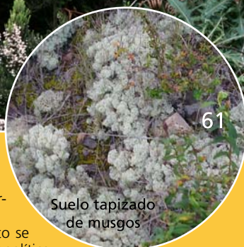
Suelo tapizado de musgos