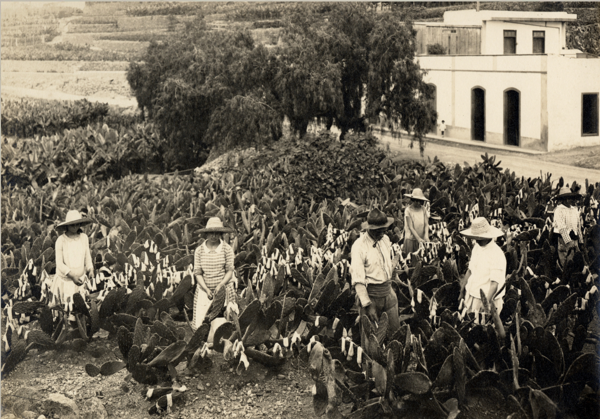
Campo de cochinillas (Bañaderos), 1928 | Archivo: 012594