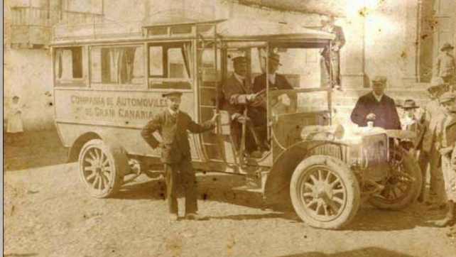
Coche de hora llega a San Mateo