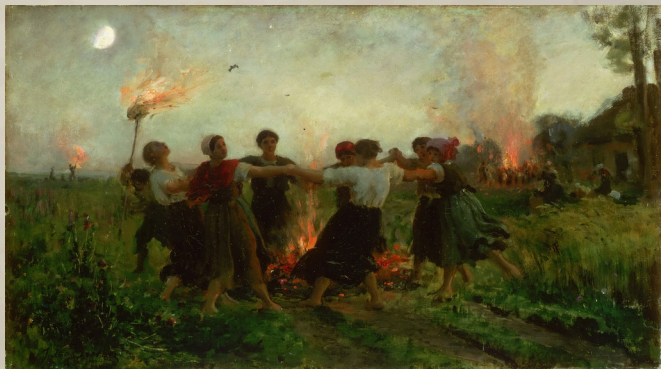
Fiesta de San Juan, obra de Jules Breton.