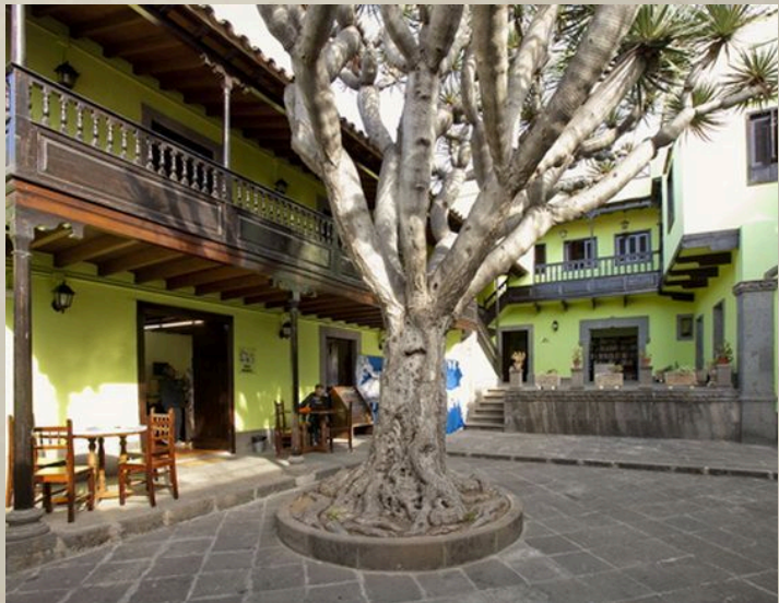
Antigua sede de la Biblioteca Municipal de Arucas.